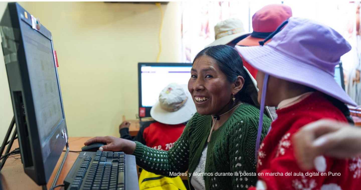
Madres y alumnos durante la puesta en marcha del aula digital en Puno

La iniciativa introduce el pensamiento computacional mediante una metodología lúdica, sin dependencia de Internet y estructurada en áreas: Rincón del Robot (experiencia con robots reales), Rincón Desconectado (algoritmos y lógica sin pantallas) y Rincón Maker (construcción con LEGO y materiales reciclables).