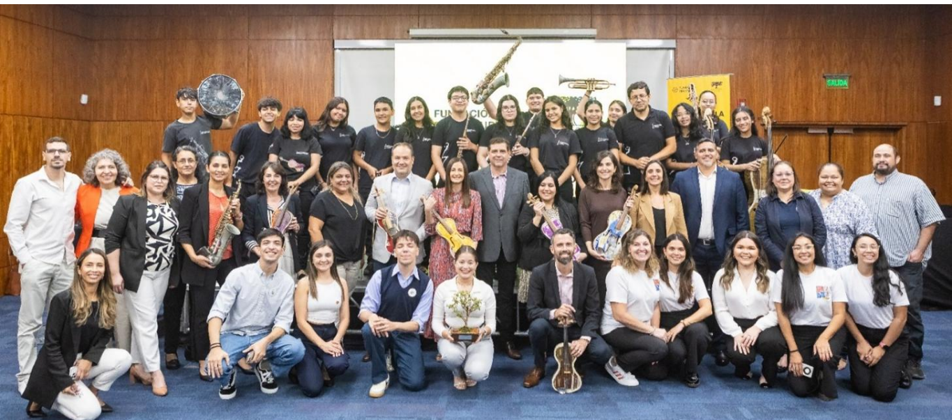
Acto de clausura del programa El Desafío por la Educación Paraguay

El jurado seleccionó como ganador al proyecto “Niños Profes” , de la Asociación Superniños . Esta iniciativa propone crear una comunidad de apoyo en las escuelas para los alumnos que no han tenido oportunidad de aprender a leer. El rasgo más innovador es que esta comunidad es liderada por otros niños y jóvenes con destacada competencia en lectoescritura. Un refuerzo entre pares – utilizando el método fonético- que fomenta la empatía y el compromiso, para que ningún estudiante se quede atrás. Superniños ha recibido un capital semilla y acompañamiento especializado para su puesta en marcha.