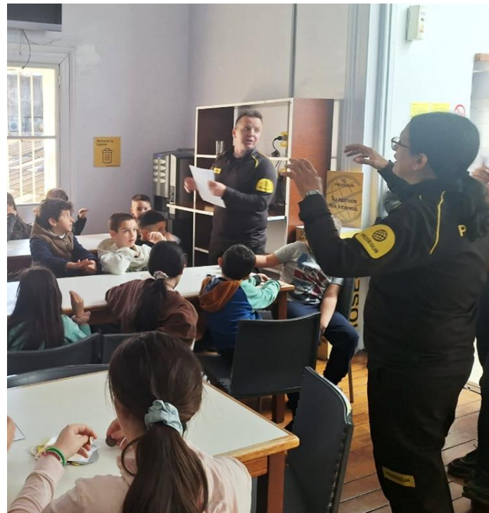
Vigilantes voluntarios impartiendo el taller de seguridad en Montevideo

Una propuesta que fortalece ante la sociedad el rol de nuestros profesionales y reafirma nuestro compromiso con la educación en seguridad .