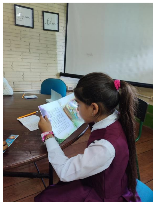
Diferentes acciones de fomento de la lectura en Chile, Uruguay y Paraguay