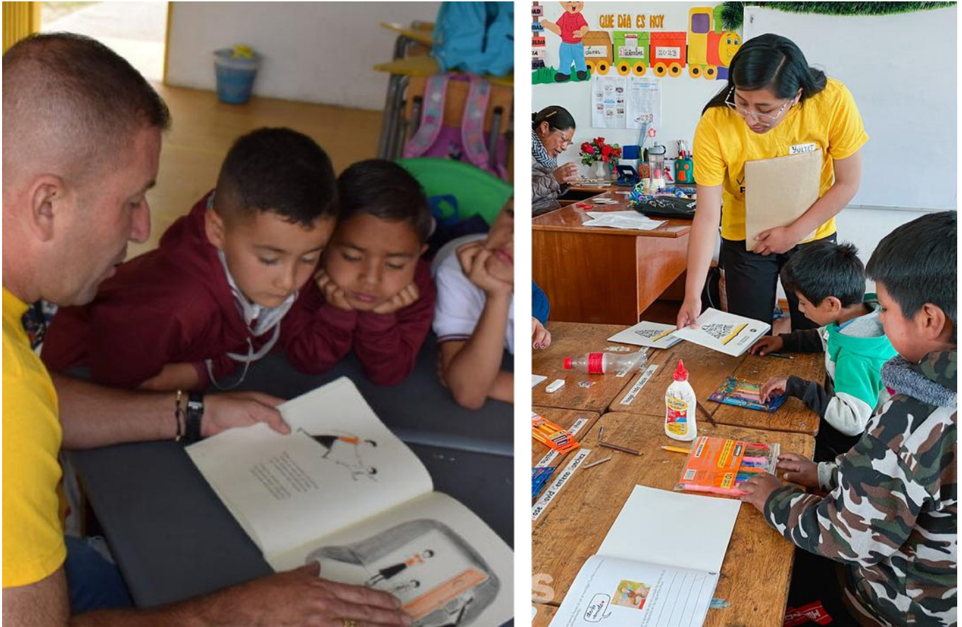
Diferentes actividades de lectura y arte impartidas por Voluntarios Prosegur en escuelas Picicitos

Los voluntarios de Latinoamérica mantienen una estrecha vinculación con el programa de Cooperación al Desarrollo y se involucran en las diferentes fases de intervención, convirtiéndose en referentes para docentes y alumnos. En este 2025, las jornadas solidarias nos han permitido trabajar en comunidad aspectos clave como el fomento de la lectura , el cuidado del agua o la reconstrucción de las huertas e invernaderos escolares , para convertirlos en espacios seguros que proporcionen alimentos nutritivos.