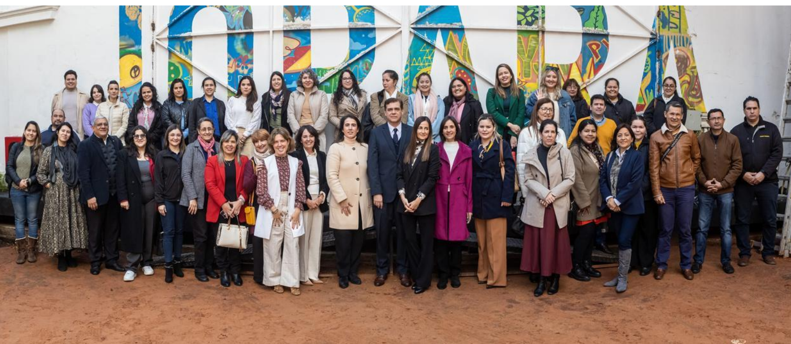
Lanzamiento del programa en Asunción, impulsado por la Embajada de España en Paraguay

En mayo de 2024, lanzamos desde Fundación la convocatoria a las organizaciones sociales paraguayas, teniendo un impacto notable: 21 entidades participantes .