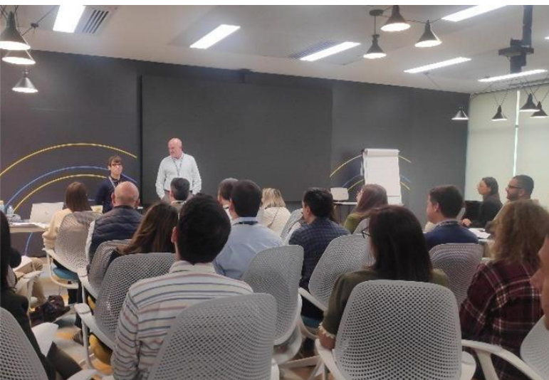
Jornada de sensibilización realizada para la incorporación en Movistar Prosegur Alarmas

Este compromiso de Prosegur por la inclusión en España ha recibido el reconocimiento de la Fundación Adisli y de la Fundación Prodis . En ambos casos, se ha destacado la apuesta de la compañía por la diversidad y el impacto que genera en este colectivo.