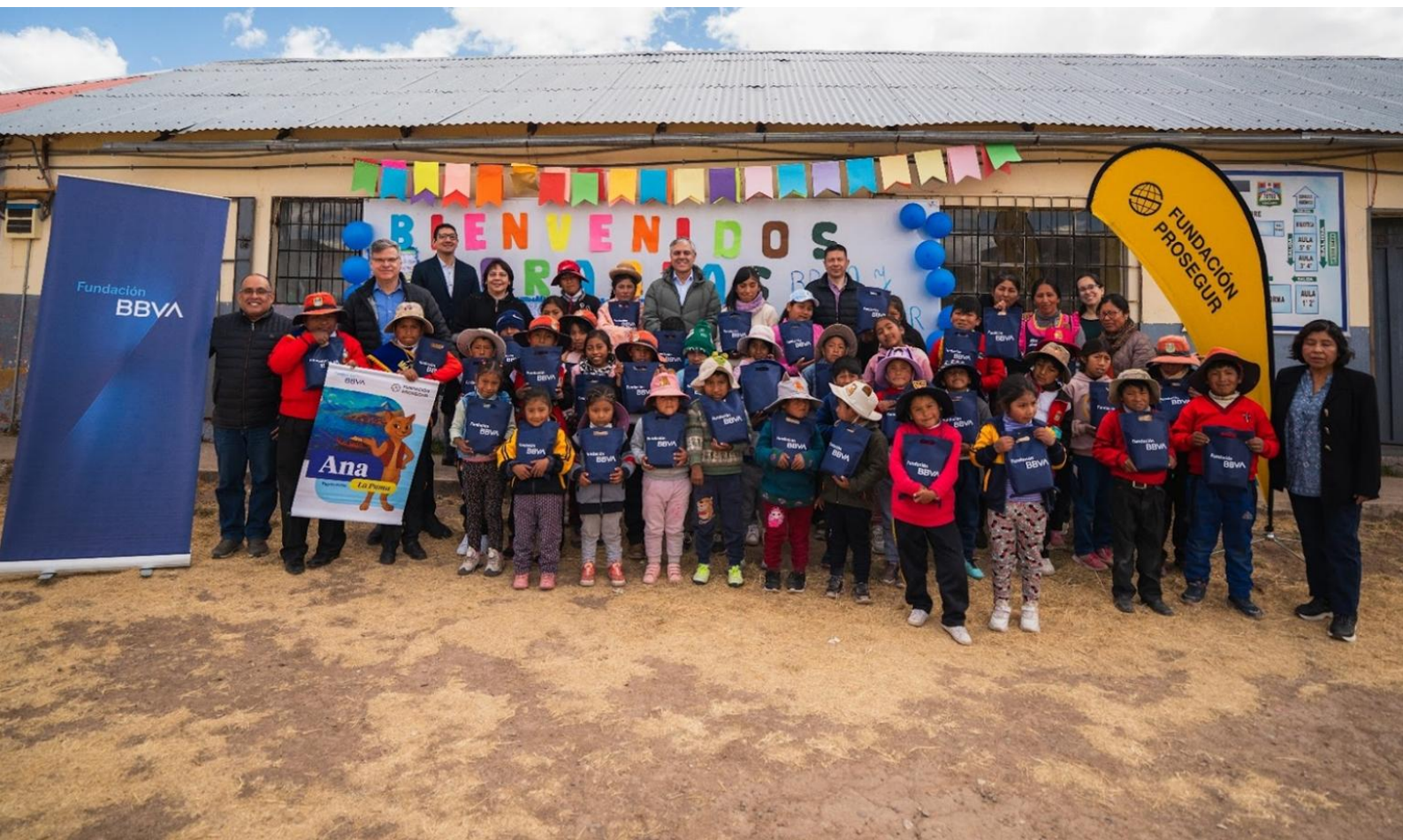
Lanzamiento del programa de lectura en la escuela Picitos de Puno, junto a Fundación BBVA Perú

Además, se han puesto en marcha rincones de lectura en las aulas y se han entregado libros para nutrir las bibliotecas escolares.