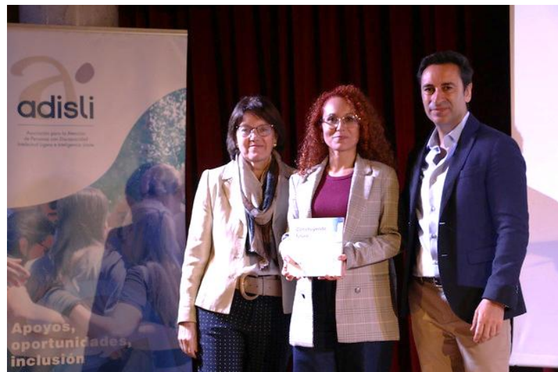
Acto de reconociendo de la Fundación Adisli