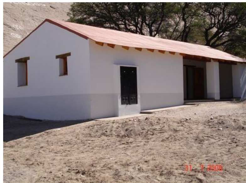
Antes de la reconstrucción