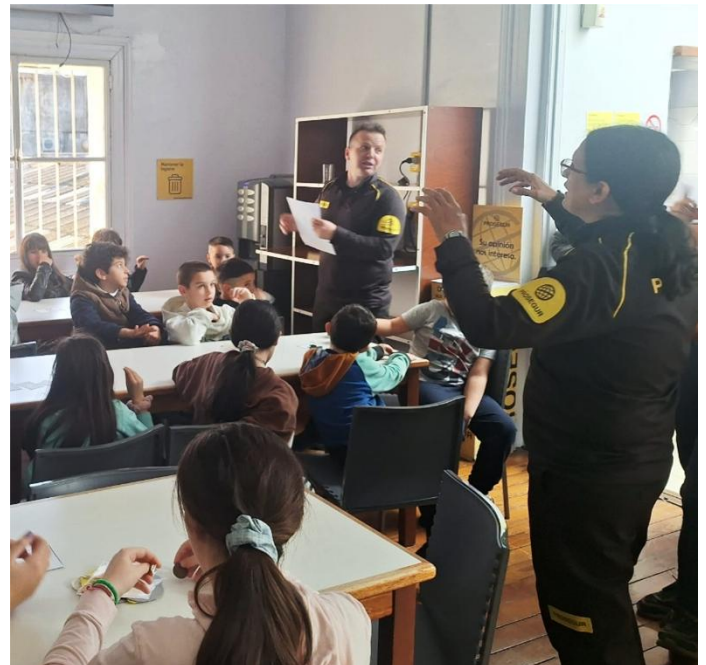
Primer taller “Nos cuidamos juntos”. Montevideo, 2025

El piloto se relató con hijos de empleados en Montevideo.