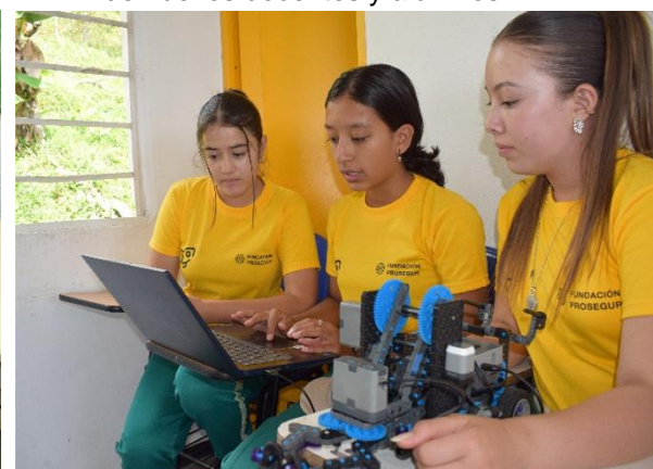
Diferentes iniciativas de robótica, programación, realidad virtual...llevadas a cabo en las escuelas.