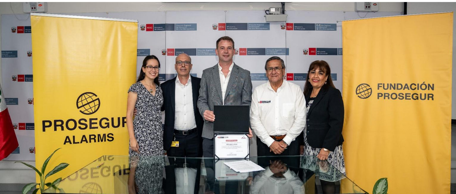
Acto de donación de dispositivos de Prosegur Alarms Perú a la DRELM (Dirección Regional de Educación de Lima Metropolitana)

Estos equipos en desuso han ido destinados a un total de nueve institutos, que imparten carreras de electrotecnia y electrónica industrial , beneficiando a estudiantes de perfil vulnerable.