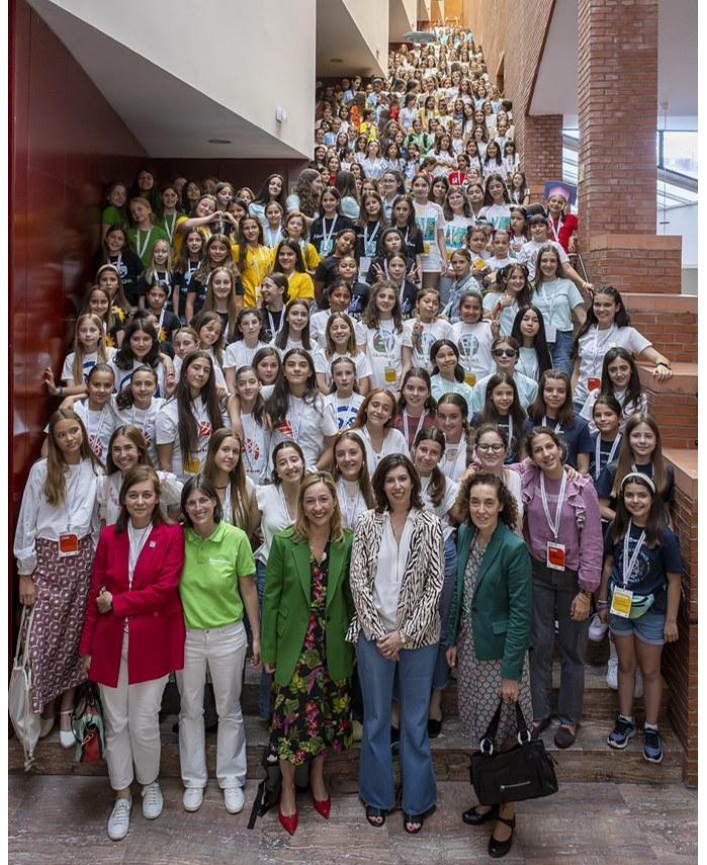
Final Regional de Technovation Girls celebrada en el Auditorio del campus de Leganés de la Universidad Carlos III de Madrid.

Además, desde 2023, nuestros profesionales se han sumado como jueces para valorar las diferentes propuestas y para impartir un taller sobre cómo hablar en público a las participantes, de cara a elaborar su pitch.