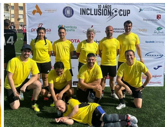
Equipo Prosegur, Inclusion Cup 2025