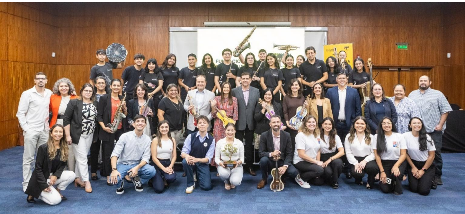
Acto de clausura en Asunción del programa El Desafío por la Educación Paraguay

El Desafío concluyó en marzo de 2025, cuando las entidades expusieron sus trabajos ante el Comité Evaluador , formado por representantes de entidades públicas y privadas, de referencia en el país, como la Embajada de España en Paraguay, la Agencia Española de Cooperación Internacional para el Desarrollo (AECID), el Ministerio de Educación y Ciencias de Paraguay, la Asociación de Empresarios Cristianos (ADEC), el Diario ABC Color o la Editorial Santillana. El Jurado declaró como proyecto ganador “Niños Protes” , de la Asociación Superniños . Esta iniciativa propone crear una comunidad de apoyo en las escuelas para los alumnos que no han tenido oportunidad de aprender a leer. El rasgo más innovador es que esta comunidad es liderada por otros niños y jóvenes con destacada competencia en lectoescritura. Un refuerzo entre pares que fomenta la empatía y el compromiso, para que ningún estudiante se quede atrás. Superniños ha recibido en 2025 un capital semilla y acompañamiento especializado para su puesta en marcha.