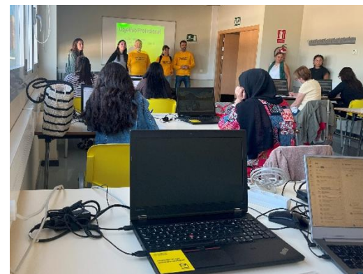
Diferentes colectivos formándose con los ordenadores donados

Desde su arranque, ya son más de 2.000 los ordenadores entregados , que han llegado a manos de estudiantes vulnerables de las escuelas Picitos Colorados y otras de su radio de acción; a centros educativos de Uruguay en colaboración con la Administración Nacional de Educación Pública; a usuarios de Centros de Integración Social y de atención a refugiados y a fundaciones que trabajan en España por la educación, la inclusión de personas con discapacidad intelectual y la Cooperación al Desarrollo.