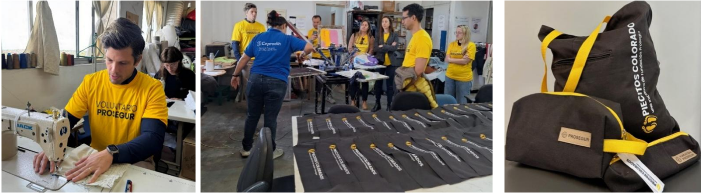
Taller de Economía circular en las instalaciones de CEPRODIH. Montevideo, 2025

En 2025 impulsamos en Uruguay una nueva iniciativa que une economía circular e inclusión: el reciclaje de uniformes en desuso de Prosegur Security , para convertirlos en productos con propósito.