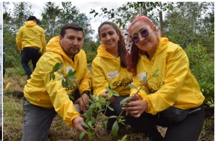
Voluntarios Prosegur en diferentes acciones de voluntariado medioambiental