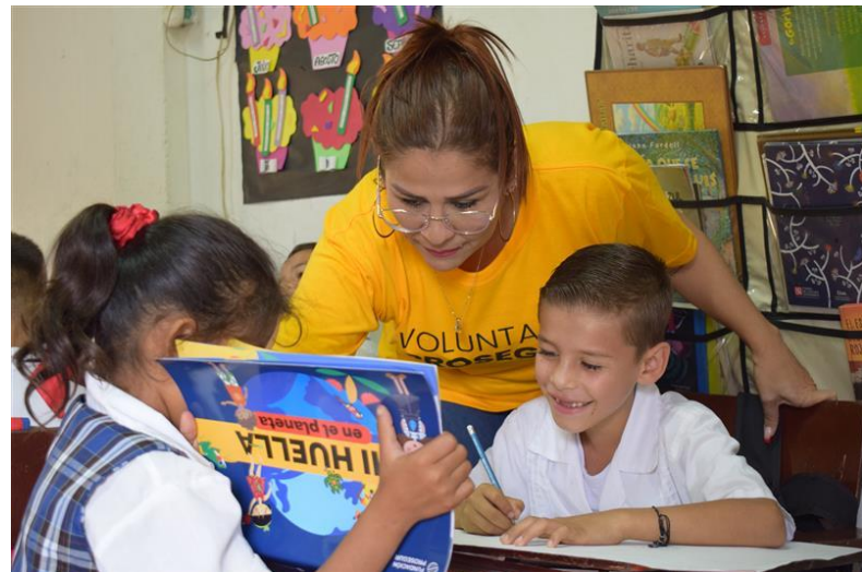
Voluntarias de Uruguay y Colombia impartiendo clases de esta iniciativa en las escuelas