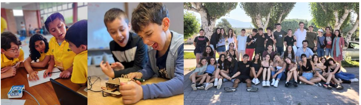
Diferentes imágenes de las actividades de recesos escolares

En Argentina, Chile, Colombia, Paraguay y Uruguay ofrecemos diferentes actividades educativas y talleres lúdicos que coinciden con las vacaciones o recesos escolares de los hijos de los empleados. Con un enfoque hacia la formación STEM, los menores trabajan destrezas tecnológicas relacionadas con la programación, robótica, impresión 3D o vuelo de drones, combinándolo con la práctica deportiva y la educación en valores.