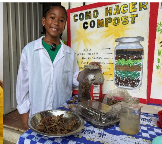
Actividades de ciencia, robótica y sostenibilidad en diferentes escuelas Picitos