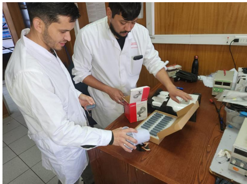
Alumnos del Liceo Politécnico Andes (Chile)