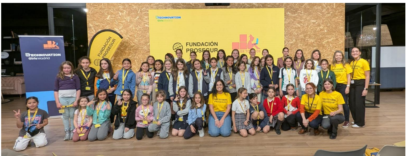
Asistentes al taller "Cómo elaborar tu pitch" celebrado en la sede de Prosegur en Madrid.