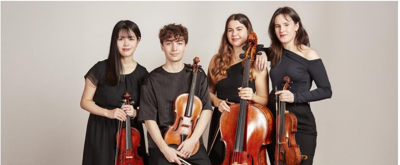
Cuarteto Albéniz de Prosegur (curso 2024-2025)

En 2025, más de 460 empleados y familiares han podido disfrutar de estos conciertos en España.