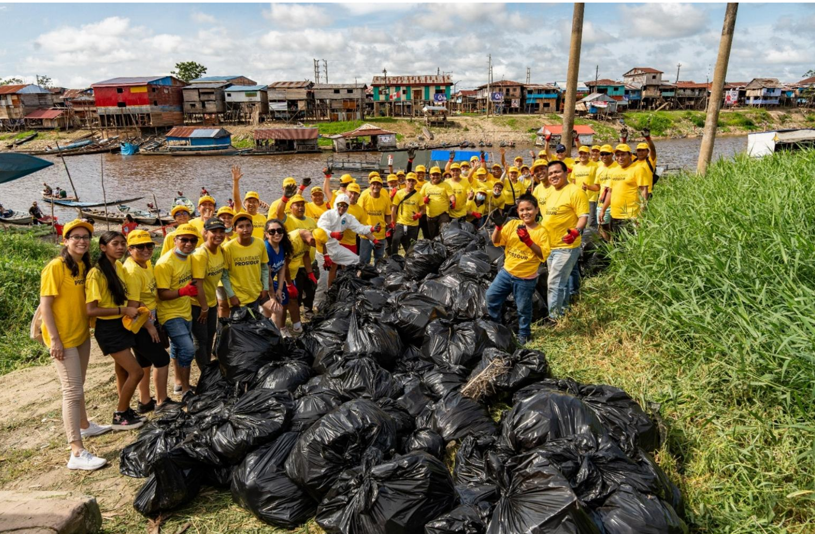
Voluntarios de Iquitos tras finalizar la acción de limpieza de la ribera del río Itaya