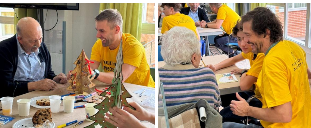
Jornada de voluntariado con personas mayores en Madrid

Con el objetivo de acompañar a las personas mayores que viven en residencias, en 2025 hemos realizado una jornada solidaria en Madrid durante la época navideña. Los Voluntarios Prosegur compartieron su tiempo, apoyando a los residentes a escribir su carta a los Reyes Magos llenando el día de conversaciones y recuerdos. Además 109 profesionales de la compañía se convirtieron en pajes reales para que personas mayores y niños en riesgo de exclusión social cumplieran sus deseos en estas fechas tan señaladas.