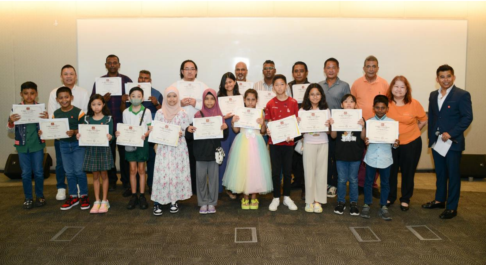
Ceremonia de entrega de Becas en Singapur

Este programa está implantado en 14 países de tres continentes : Argentina, Chile, Colombia, Costa Rica, El Salvador, Ecuador, España, Guatemala, Honduras, Nicaragua, Paraguay, Perú, Singapur y Uruguay.