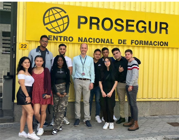
Estudiantes del programa de Formación a Medida en el Centro de Formación de Prosegur en Madrid

En 2024 destacan las iniciativas llevadas a cabo en Chile , junto a Prosegur Cash, Prosegur Alarms y el área de RRHH que han logrado potenciar nuestras relaciones con la comunidad local donde operamos: la Municipalidad de Renca. Así, hemos impartido charlas en el Liceo Politécnico Andes, donde profesionales de Prosegur capacitaron a los docentes sobre cómo adaptar sus planes de estudio a las necesidades reales de la industria.